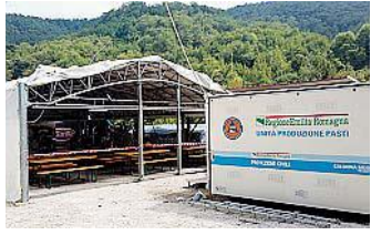
SOSTEGNO Sopra, in piccolo, l'unità centro pasti. A destra, la tendopoli di Uschemo a cura della Protezione civile regionale