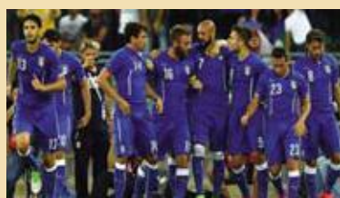
Italia - Francia Calcio: amichevole tra nazionali