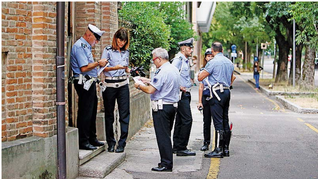
ACCERTAMENTI IN CORSO Sopra la polizia municipale durante i rilievi dell'altro pomeriggio in viale Caduti in guerra, a destra le verifiche dopo lo schianto in tangenziale causato dal tentativo di suicidio