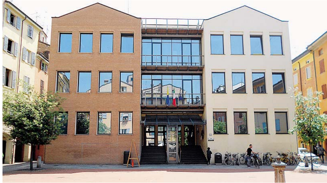
PIAZZALE REDECOCCA Gli uffici del Quartiere 1 accoglieranno i residenti in centro e nella zona di San Cataldo