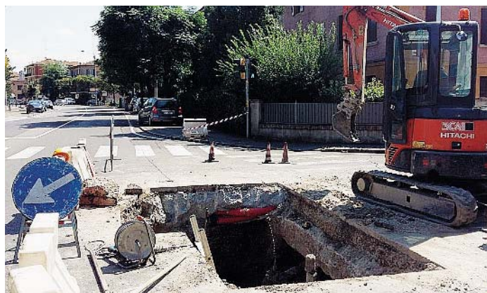
MULTIUTILITY Tecnici di Hera al lavoro in via Vignolese

SERVIZI Oggi i tecnici di Hera in azione per sostituire una valvola dopo le opere di due settimane fa