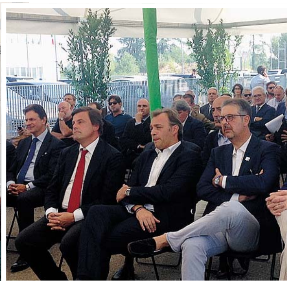
OSPITE IL MINISTRO A Spilamberto anche Carlo Calenda (a sx), titolare del Mise, e il parlamentare Matteo Richetti

un primario gruppo giapponese e commercializzare i nostri prodotti nel sud est asiatico, dove peraltro siamo già presenti come fornitore di Mitsubishi Electric. Sono inoltre in fase avanzata contatti per accordi con importanti player in Spagna e Francia», ha chiuso il cofondatore di Aton.