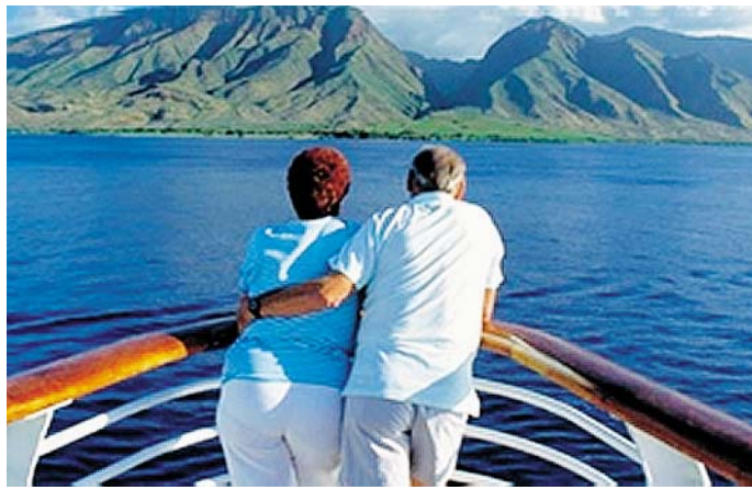
AUMENTO ANCHE CONGIUNTURALE Fisiologico quello dei prezzi nei mesi estivi

del mese (+1,2%) si è registrato alla divisione «Trasporti», nella quale fattori appunto di natura stagionale contribuiscono a spiegare gli aumenti sul trasporto passeggeri aereo, marittimo e su rotaia (rilevazione nazionale), trasporto passeggeri urbano e servizi relativi ai mezzi di trasporto (rilevazione locale). In diminuzione la spesa per l'acquisto di automobili (rilevazione nazionale) e per i carburanti per autotrazione (rilevazione locale). Il secondo aumento più marcato (+1%) è stato rilevato alla divisione «Ricreazione spettacolo e cultura» in particolare per le classi di spesa quali libri, pacchetti