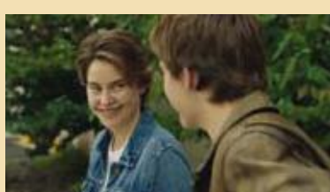
Colpa delle stelle Con Shailene Woodley e Ansel Elgort