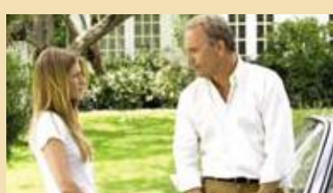
Vizi di famiglia Con Jennifer Aniston e Kevin Costner