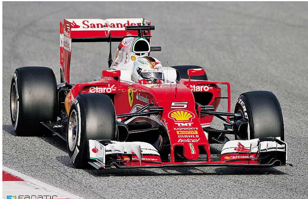
PROVACI ANCORA SEB Sebastian Vettel punta alla prima vittoria stagionale sul circuito dei ferraristi

Passiamo ora alla parte sportiva, quella che porta il maggiore interesse tra gli appassionati. Piccante la vicenda della Ferrari. L'ultima vittoria del Cavallino nel gp di Italia risale al 2010, Alonso poi beffato nella rincorsa al titolo iridato da un errore strategico nella gestione da parte della squadra, all'ultima gara, a favore di Vettel. Vettel che a Monza ha vinto il suo primo GP, con la ex Minardi, prima di iniziare la escalation mondiale con la Red Bull e che l'anno passato ha inseguito vanamente Hamilton, arrivando alle sue spalle. Il tedesco vuole riscattare quanto gettato al vento a Spa in società con Raikkonen e con quella gran mano data loro da Verstappen che ora è un osservato speciale da parte di tutti. In queste ore, il simulatore, "remote garage", la replica delle prove e delle gare che avviene in diretta nei fine settimana di gare a Maranello, sono stati usati a pieno ritmo per realizzare un pacchetto di strategie, ristrette, da portare in pista già da domani per un'ulteriore scrematura. I componenti di base di queste strategie sono: motori, aerodinamica, freni e melange dei pneumatici a disposizione e su cui andrà ad incidere molto la temperatura ambiente. L'aerodinamica dovrebbe subire un'ulteriore evoluzione di quanto già approntato a Spa, che sembra aver dato risultati interessanti. Il gap nei confronti della Mercedes è stato ridotto a un paio di decimi. La ricerca punta ad avere la velocità di punta massima, che su questo circuito è sem-