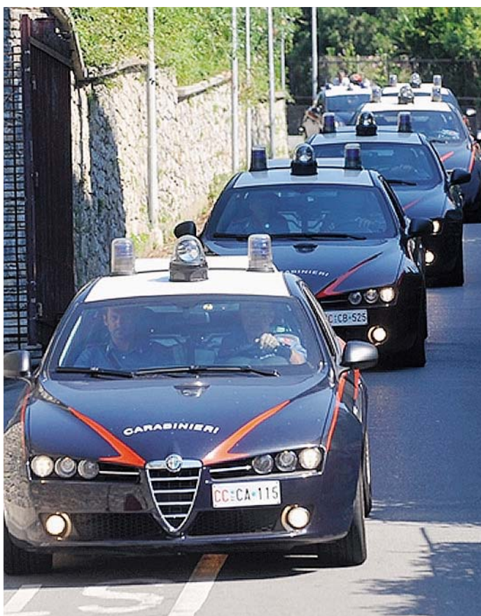
GAZZELLE Sui due episodi hanno indagato i carabinieri della compagnia di Modena

CRIMINALITA' Aumentano i furti negli abitacoli delle macchine: i cittadini avevano scordato gli effetti personali a bordo