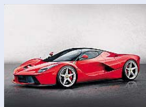
IBRIDA LaFerrari

All'asta (da 1,2 milioni) una rossa pro terremotati