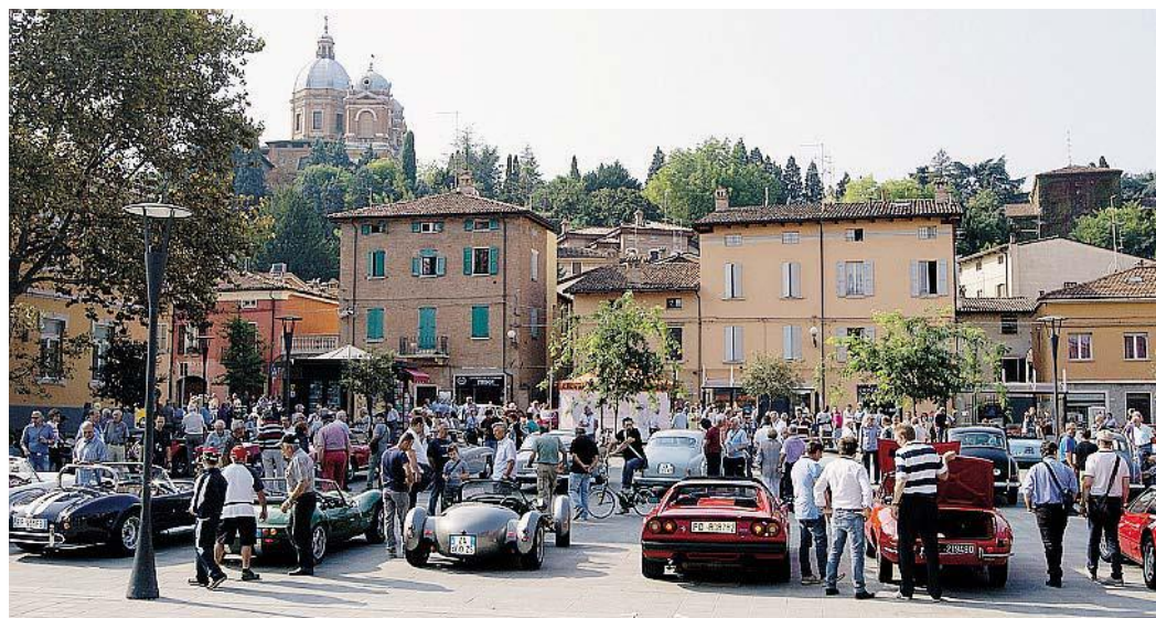
OPPORTUNITA' Una veduta del centro fioranese

venti a sostegno dell'occupazione, come 'La Formazione scommette sul futuro', la cui gestione, quest'anno, è stata affidata a Cerform, che preve-