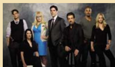
Criminal Minds Con Thomas Gibson e Shemar Moore