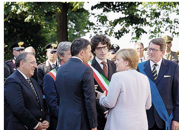
SGUARDO ALL'EUROPA Per Merkel e Renzi nel vertice bilaterale tra Italia e Germania, svoltosi ieri a Maranello