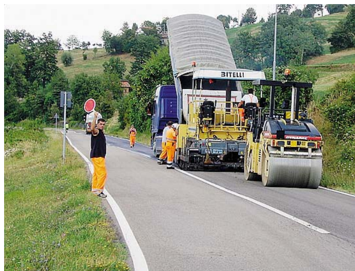
OPERAZIONI Nella foto di repertorio, interventi sulle strade

Lavori prevedono la fresatura di 3 centimetri e la stesura di un nuovo manto d'asfalto