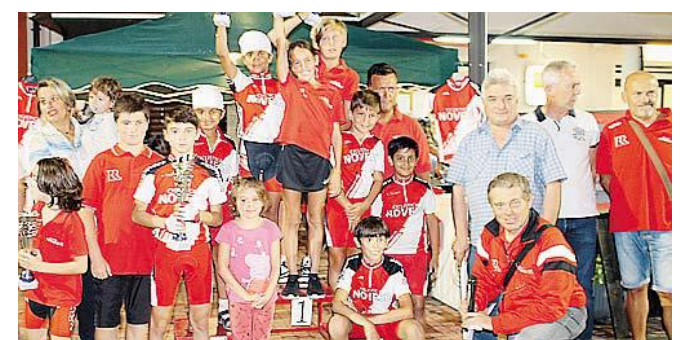
SAN POSSIDONIO La Novese in festa