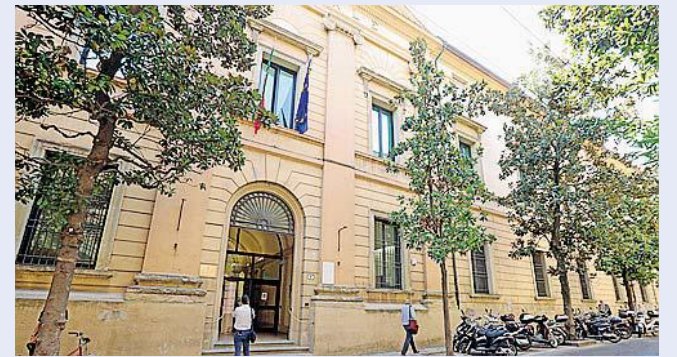
INQUIRENTI La Procura di Bologna

questrato una lama, senza manico, che lui ha detto di utilizzare per tagliare la frutta. E hanno trovato in suo possesso due banconote da 50 euro e una da cinque: a dire del clochard, denaro percepito dall'Inps. Gli investigatori allora hanno avviato una verifica con l'istituto e quando hanno avuto la conferma che non è beneficiario di una pensione, sono tornati al casolare: era il frutto della rapina. Alla vista dei carabinieri, l'uomo avrebbe fatto una parziale ammissione, poi completata nell'interrogatorio davanti al pm in caserma, mercoledì. Ha spiegato di aver avvicinato l'anziano per chiedergli qualche spicciolo. E ha detto che, dopo aver ricevuto un diniego, lo ha aggredito con una corda di canapa, quindi lo ha spinto oltre un cespuglio e gli ha detto di consegnare il portafogli. A quel punto, preso dalla paura di essere stato riconosciuto, ha sferrato il colpo con la lama.