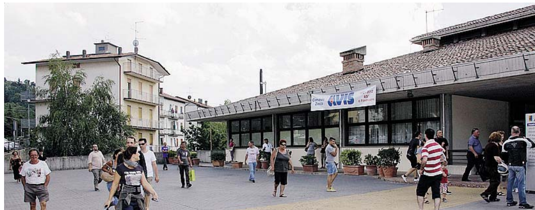
VALUTAZIONI Sopra il municipio zocchese, a sinistra il sindaco Gianfranco Tanari