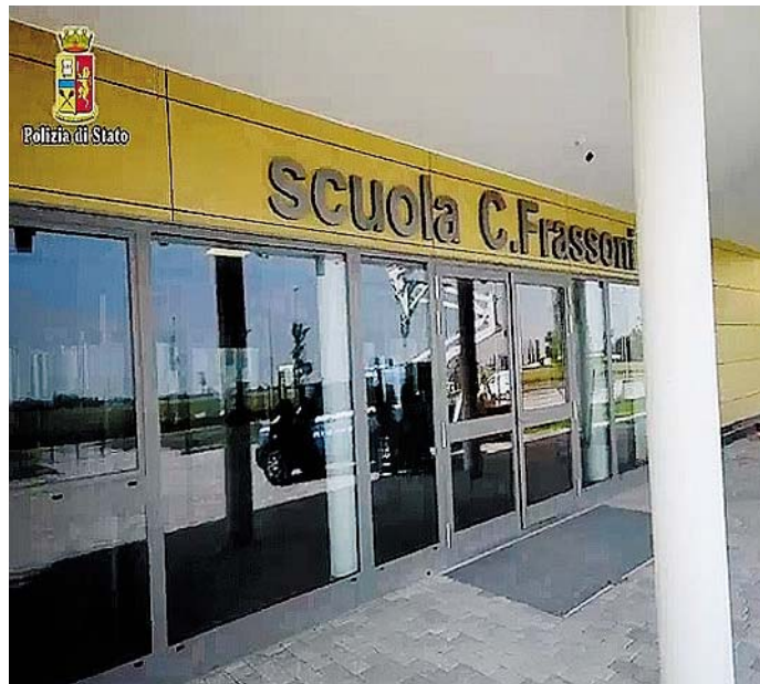
CEMENTO DEPOTENZIATO Le scuole medie Frassoni di Finale

Entro fine settembre il giudice per le indagini preliminari del tribunale di Modena