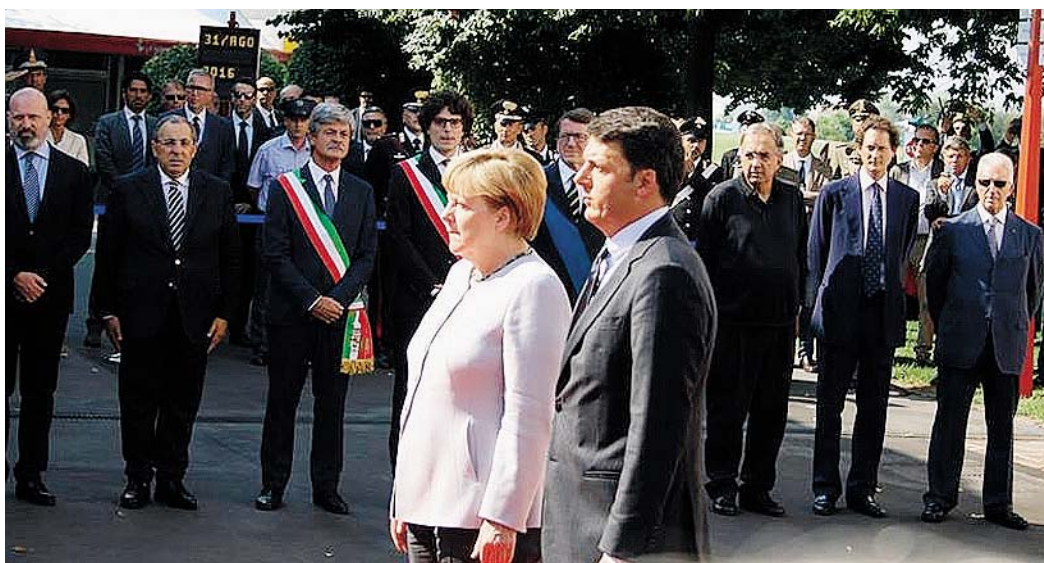
I MOMENTI SALIENTI Nelle foto, la giornata di Matteo Renzi e Angela Merkel a Maranello. In alto a sinistra, l'arrivo alla pista di Fiorano; a destra, il picchetto d'onore degli allievi dell'Accademia militare di Modena, insieme ai lancieri di Montebello. In basso a sinistra, l'incontro con protezione civile, vigili del fuoco e Croce rossa; a destra, lo chef Massimo Bottura a tavola in attesa... degli ospiti

Nella foto, l'incontro tra il premier Renzi e il cancelliere Merkel e la delegazione di protezione civile, vigili del fuoco e Croce rossa. A sinistra, la conferenza stampa; a destra, la Merkel con il cane Leo