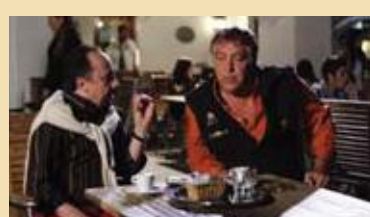
E io non pago Con Maurizio Mattioli e Maurizio Casagrande