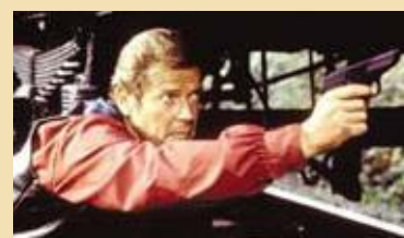
Octopussy - Operazione piovra Con Roger Moore e Maud Adams